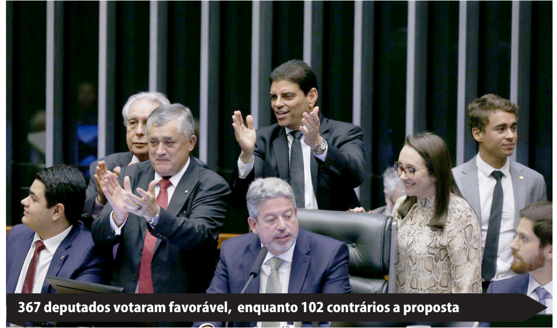
367 deputados votaram favorável, enquanto 102 contrários a proposta

Mais cedo, em audiência pública na Câmara dos Deputados, o ministro da Fazenda, Fernando Haddad, afirmou que o novo arcabouço fiscal está sendo construído de forma a "despolarizar" o país e que tem conversado com parlamentares da base governista e da oposição em busca de apoio ao projeto.