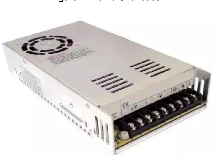
Figura 1: Fonte Chaveada