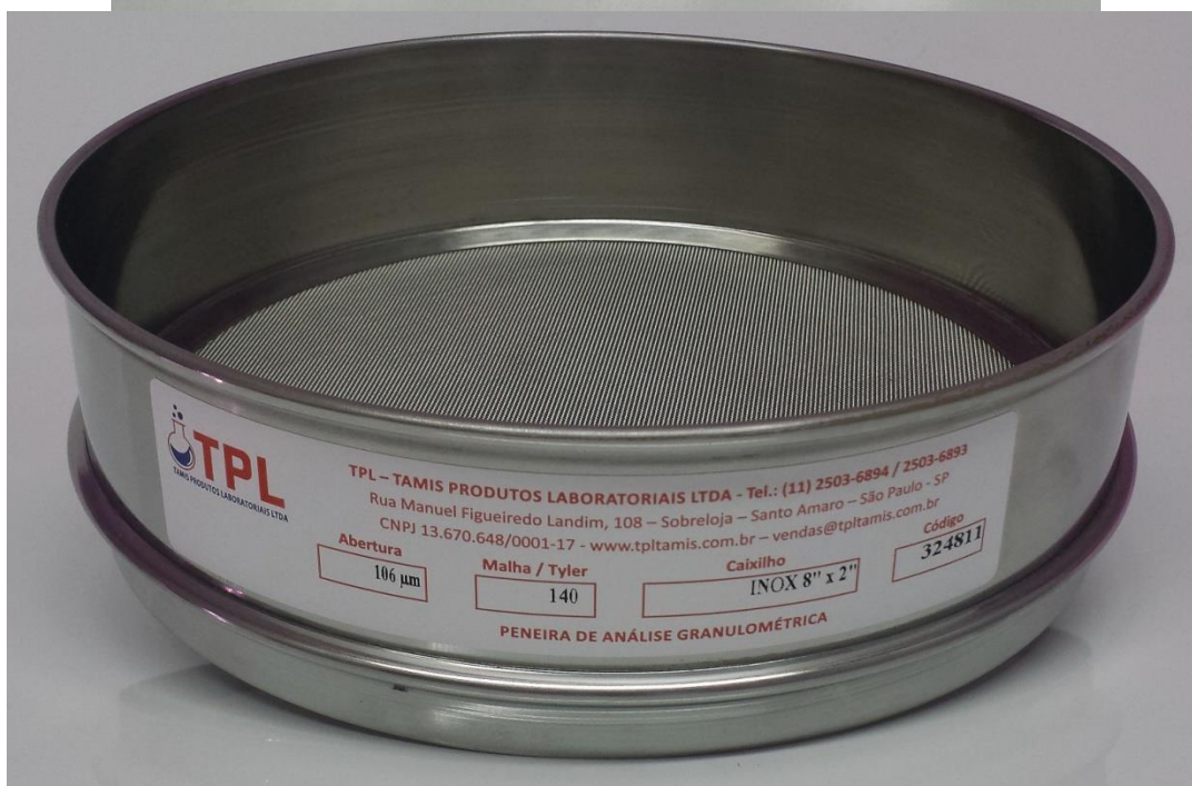
FOTO MERAMENTE ILUSTRATIVA MALHA CONFORME SOLICITAÇÃO DO CLIENTE