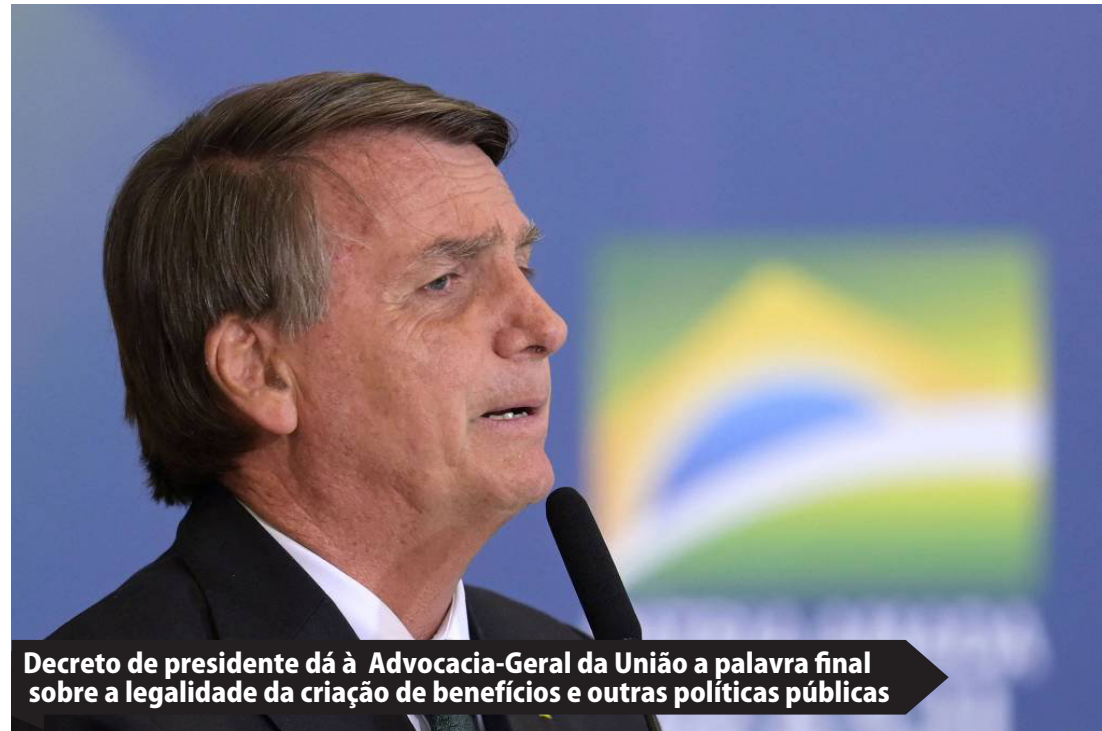
Decreto de presidente dá à Advocacia-Geral da União a palavra final sobre a legalidade da criação de benefícios e outras políticas públicas

A pesquisa foi feita nos dias 22 e 23 de junho. Foram realizadas 2.556 entrevistas em todo o Brasil, distribuídas em 181 municípios. A margem de erro é de 2 pontos percentuais, para mais ou para menos.