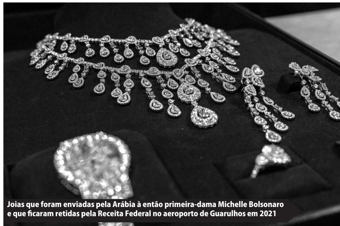
Joias que foram enviadas pela Arábia à então primeira-dama Michelle Bolsonaro e que ficaram retidas pela Receita Federal no aeroporto de Guarulhos em 2021

O ministro Alexandre Padilha (Relações Institu-