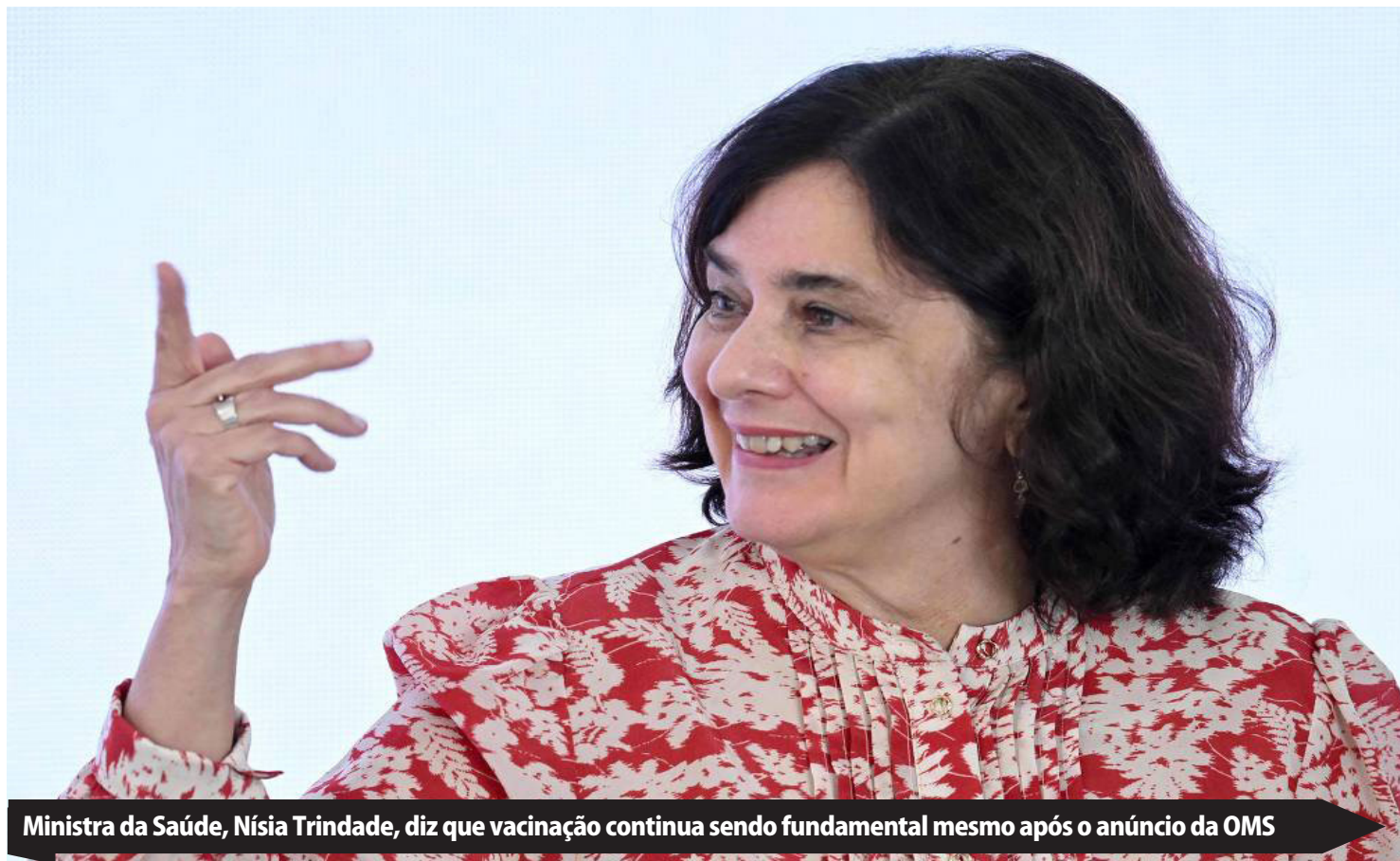
Ministra da Saúde, Nísia Trindade, diz que vacinação continua sendo fundamental mesmo após o anúncio da OMS

A indicação de que uma doença representa uma emergência de saúde global se dá por um comitê formado frente a uma possível ameaça. Os membros desse conselho se reúnem e aconselham o diretor-geral da OMS, Te-