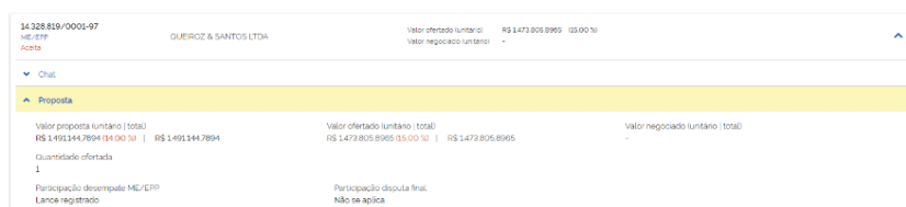
FIGURA 3 - PROPOSTA DA EMPRESA QUEIROZ & SANTOS LTDA COM LANCE DE DESEMPATE

A Lei Complementar n° 123 de 2006 estabelece, no Art. 3o inciso I, a definição de microempresa e de empresa de pequeno porte, nos seguintes termos: