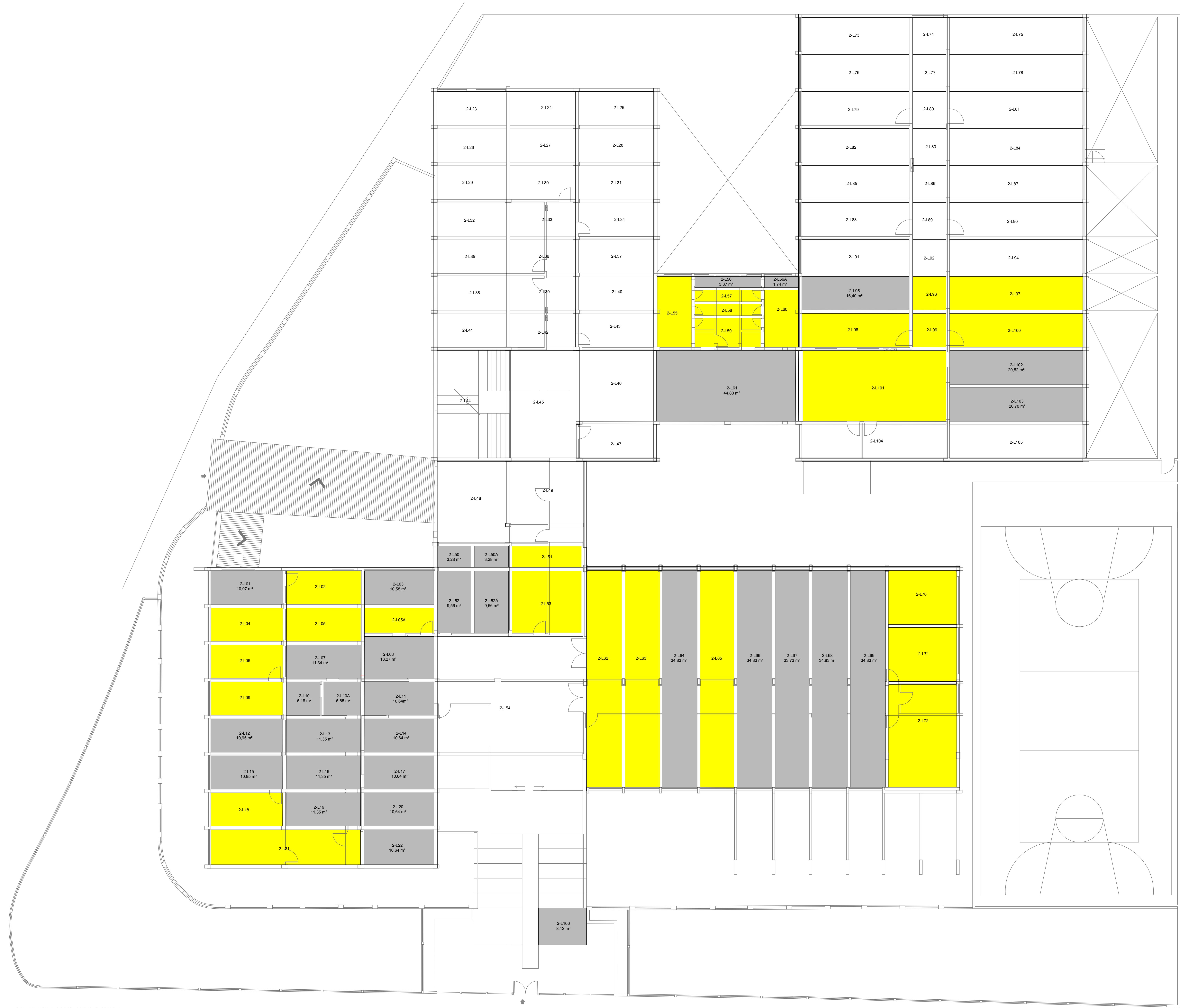
PLANTA BAIXA LAJES - PVTO. SUPERIOR Escala 1:100