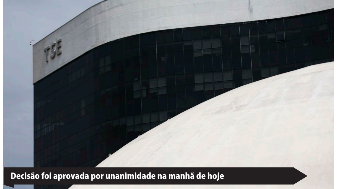
Decisão foi aprovada por unanimidade na manhã de hoje

Moraes disse que já tratou desses assuntos com representantes das redes sociais, e que se reunirá com os advogados dos dois candidatos, que estavam presentes na sessão: “isso será bem especificado para evitar, depois, qualquer acusação de abuso de poder político ou econômico utilizando a internet”. (Com informações da Agência Brasil)