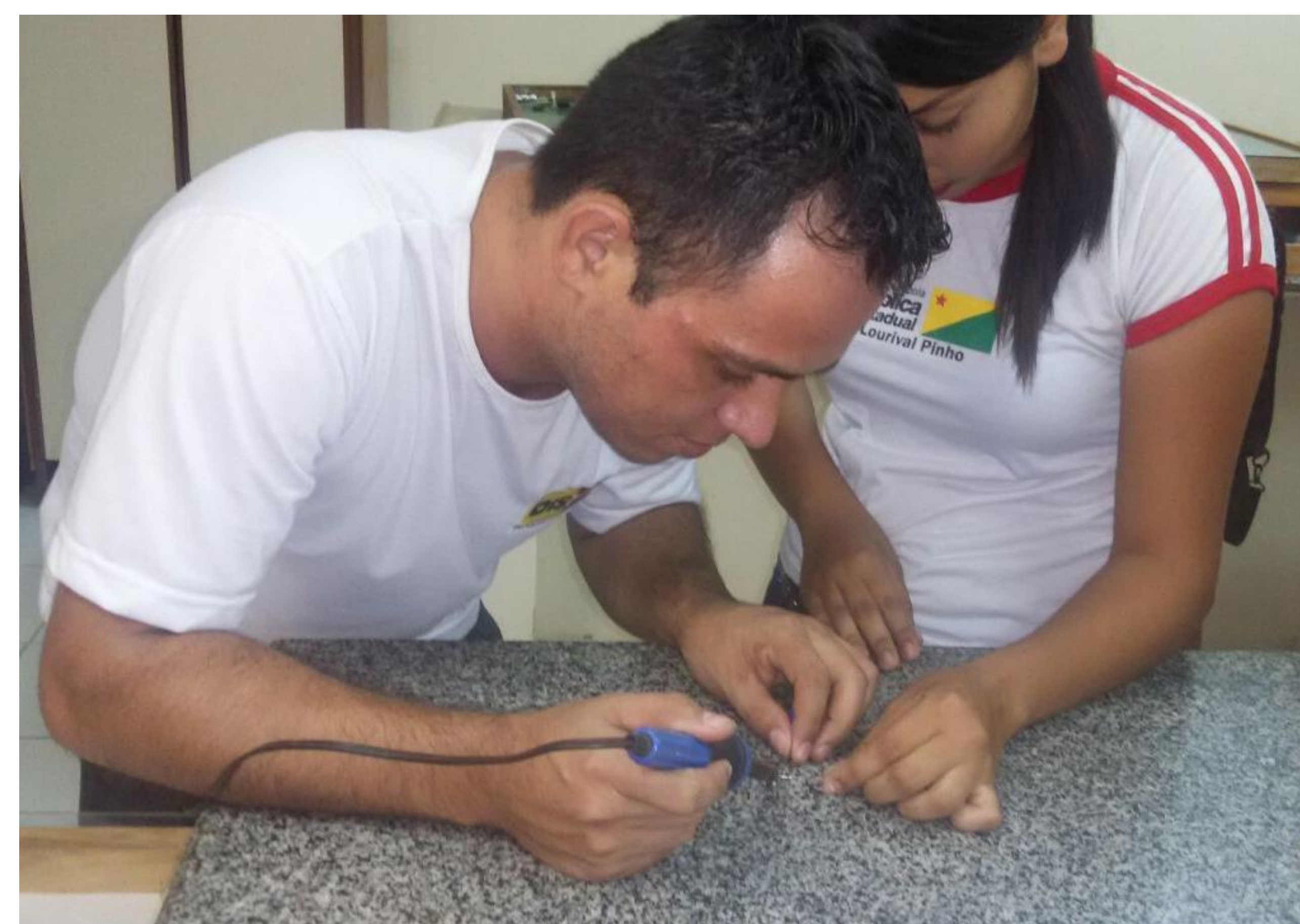
Figura 3: Os alunos construindo a barata elétrica no laboratório da escola Lourival Pinho