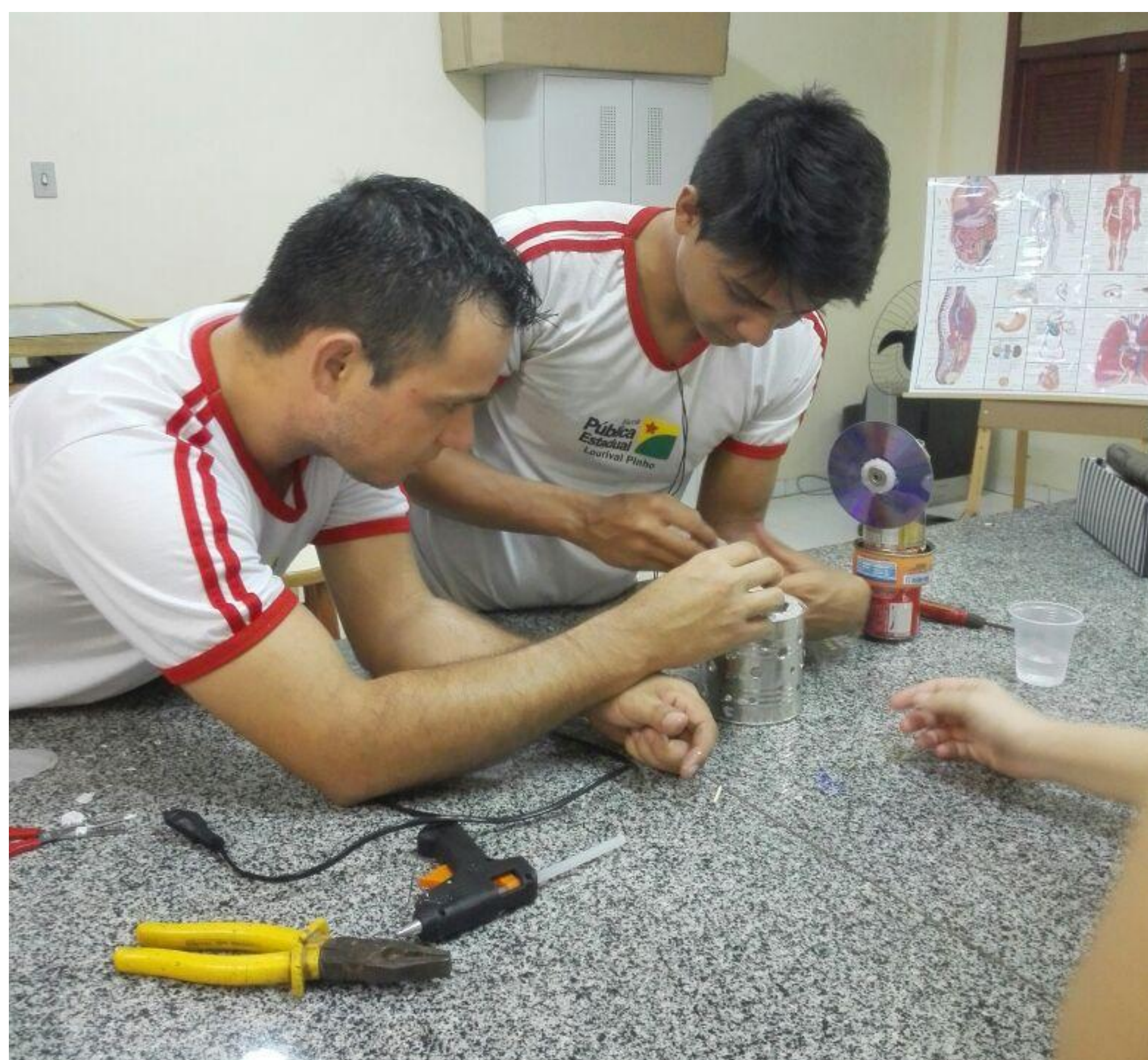
Figura 1: Os alunos construindo o motor Stirling, no laboratório da escola Lourival Pinho

Terceira etapa – Estudo dos fenômenos envolvidos nos experimentos.