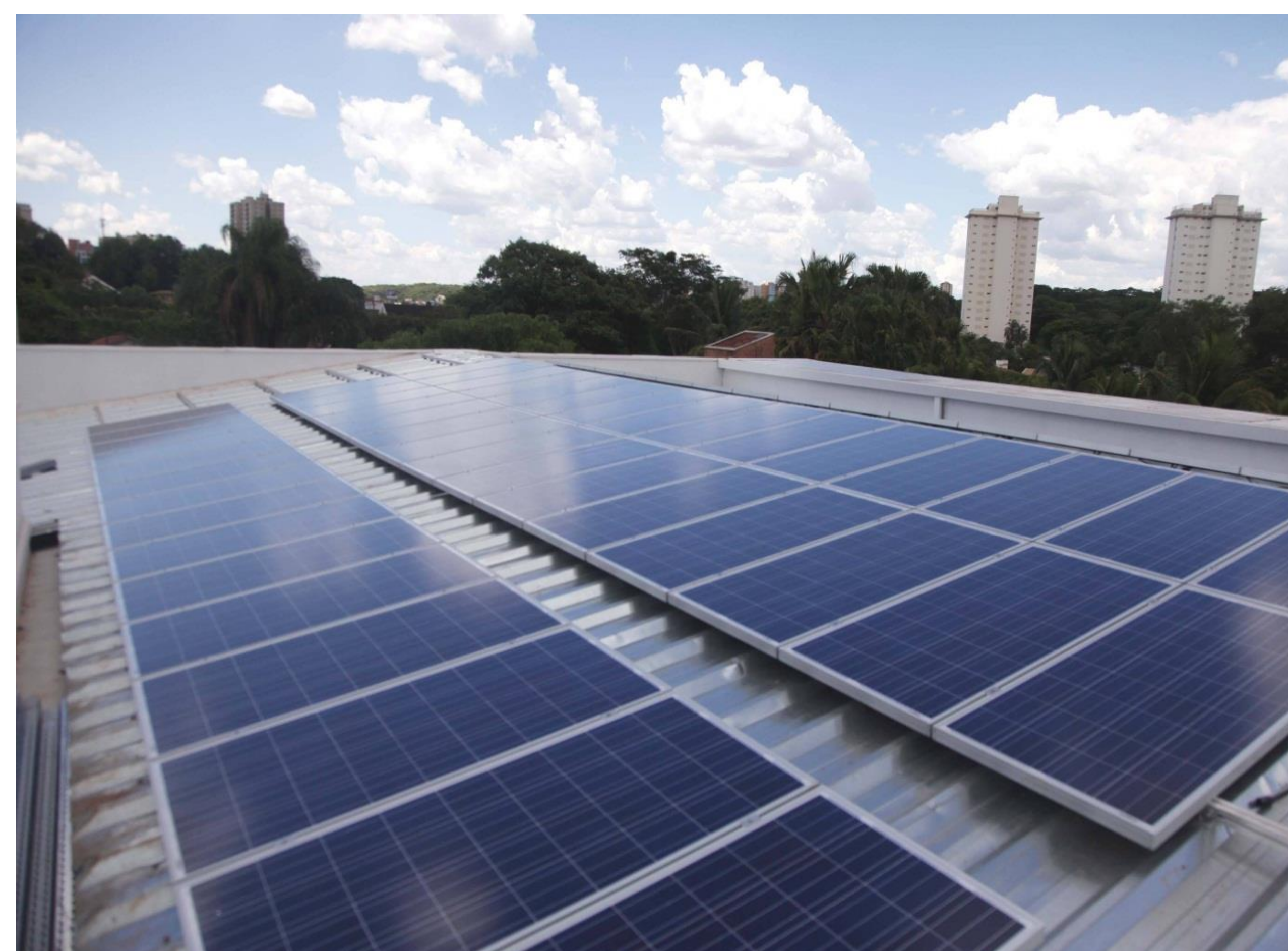
Imagem 01: Placa Solar

Com este trabalho, as placas de células solares fotovoltaicas serão feitas com o menor custo possível e conseguiremos a maioria dos materiais reutilizáveis. Também, estamos buscando obter energia suficiente para que as atividades que utilizam eletroeletrônicos sejam capazes de funcionamento a longo prazo. Buscamos incentivar os grandes mercados, escolas (qualquer lugar que tenha um grande gasto de energia) a divulgar e compreender nossas ideias.