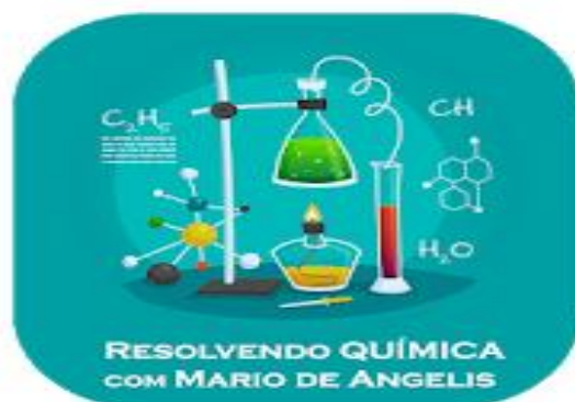
Imagem 1: Aplicativo “Resolvendo Química com Mário de Angelis”

“Resolvendo Química com Mário De Angelis” é um aplicativo desenvolvido por mim em parceria com o grupo KATSU (imagens 1 e 2), sendo este um recurso metodológico que facilitará o processo de ensino e aprendizagem motivando os alunos, despertando o interesse, estimulando as capacidades intelectuais, emocionais e sociais, aprimorando raciocínio lógico e buscando resolução de soluções-problemas. O aplicativo é composto por aulas tradicionais gravadas e também por aulas editadas (imagem 3), com utilização de filtros específicos mencionados no corpo da dissertação. Também está presente no menu exercícios resolvidos para melhor fixação do conteúdo (imagem 4). O questionário aplicado aos docentes e aos discentes também encontra-se no aplicativo. Os resultados obtidos em gráficos já são produzidos em páginas da web geradas por softwares mencionados na pesquisa. O aplicativo pode ser baixado na plataforma google pelo link: https://play.google.com/store/apps/details?id=br.com.marioquimica , que o direcionará para a loja virtual de aplicativos Google Play (antigamente conhecido como Android Market) que é um serviço de distribuição digital de aplicativos, jogos, filmes, programas de televisão, músicas e livros, desenvolvido e operado pela Google. Ela é a loja oficial de aplicativos para o sistema operacional Android.