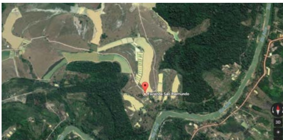
Figura 2. Piscicultura São Raimundo, localizada na Estrada do Panorama km 8.

No período de ago/2016 a mai/2017, foi escolhida uma piscicultura, localizada na estrada do Panorama km 8 (Figura 2). A piscicultura possui sistema de cultivo intensivo com tanque escavado, sistema e aeração natural. A quantidade de água do tanque era de 5.000m em 1,90cm de profundidade (Figura 3).