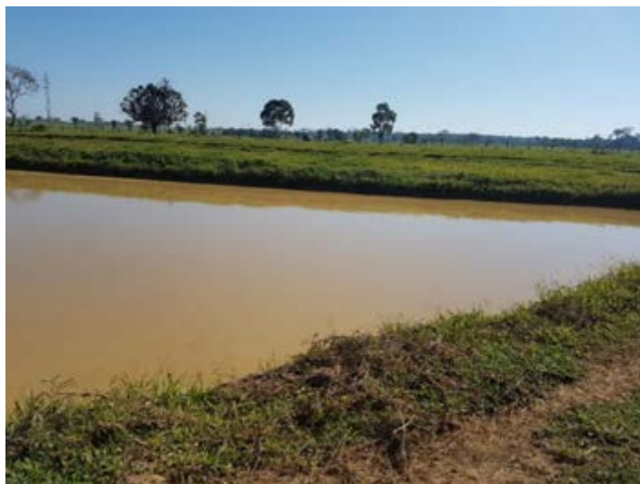
Figura 3. Tanque escavado com cultivo de Pintado-da-Amazônia ( P. fasciatum x L. marmoratus )