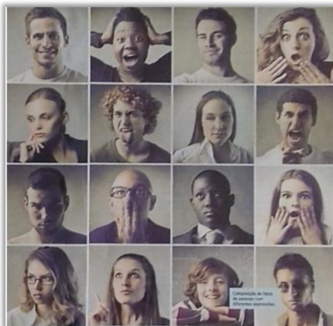
Figura 3 - Imagens de rostos

Para continuar a atividade, distribua a imagem a seguir, que retrata rostos com diferentes expressões. Na imagem, é possível notar a presença de diferentes sensações e sentimentos humanos. A partir dela e dos textos lidos anteriormente, conduza um momento de reflexão.