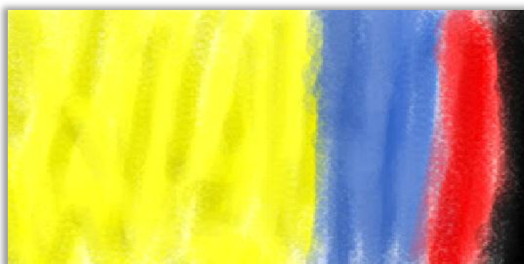
Figura 4 - Exemplo do formato da pintura